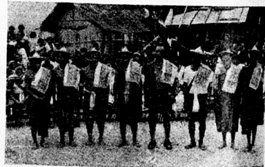
চেদেমা গাঁৱৰ মুখিয়ালসকল।

নগালেণ্ডৰ অসম সাহিত্য সভাৰ প্ৰতিনিধি দল : প্ৰতিবেদন