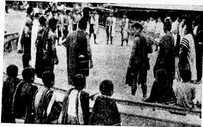
চেদেমা গাঁৱৰ ডেকা-পাভক প্ৰতিনিধি দলটোৰ সন্মুখ সভা-পীঠৰ আয়োজন কৰিব।