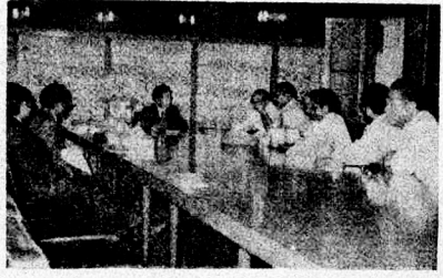
নগালেণ্ডৰ মুখ্যমন্ত্ৰী শ্ৰীভিছল আৰু মন্ত্ৰীসভাৰ সদস্যসকলৰ লগত অসম সাহিত্য সভাৰ প্ৰতিনিধি দলটোৱে আলোচনা কৰিছে।