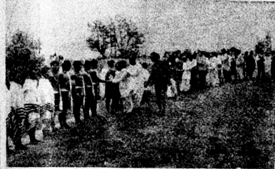
ৰেবেদমা গাঁৱত অসম সাহিত্য সভাৰ গাঁৱাতী দলক আৰণ্ণি জনাইছে।